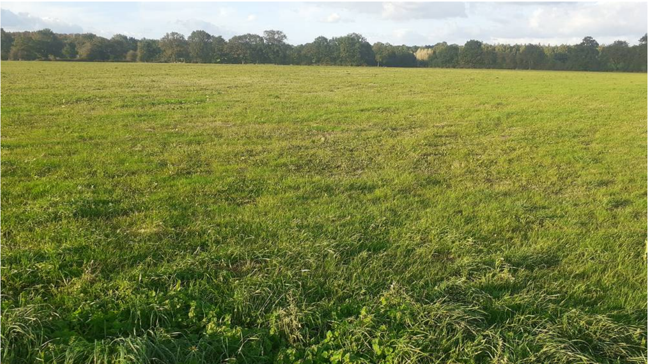
Le site de la Gourbillière (commune de SOUDAN)

Enquête publique du 19 octobre au 19 novembre 2022 inclus